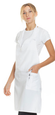
11 - ○ Bianco