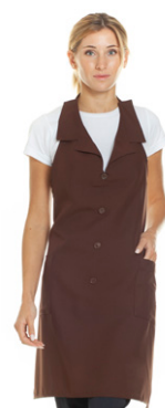
30 - ● Marrone