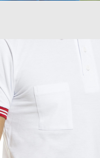
Taschino lato destro