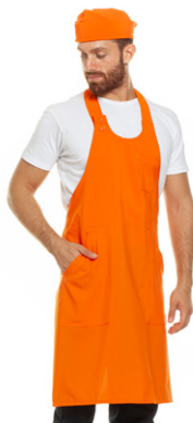
03 - ● Arancio