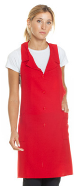
05 - ● Rosso