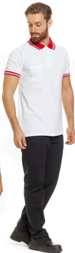
1105 - ● Rosso