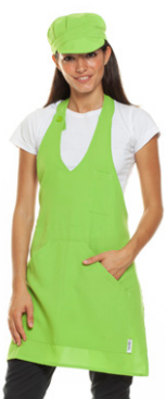
12 - ● Verde Mela