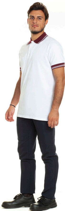
1126 - ● Bordeaux