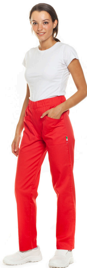
05 - ● Rosso