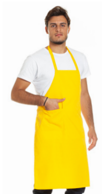
06 - ● Giallo