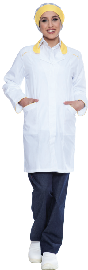
11-06 - ● Giallo