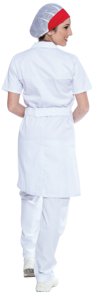
11 - ○ Bianco