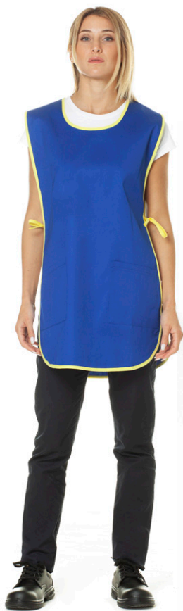
04/06 - ●● Blu Royal/Giallo