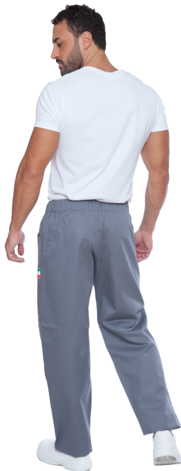
02 - ● Grigio