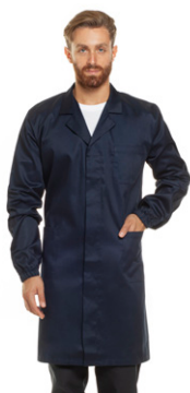
01 - ● Blu Navy