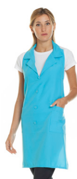
23 - ● Turchese