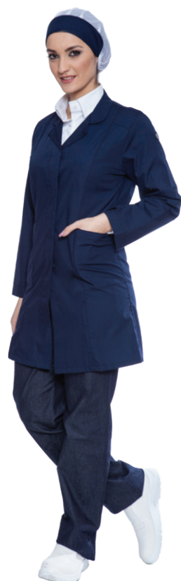
01 - ● Blu Navy