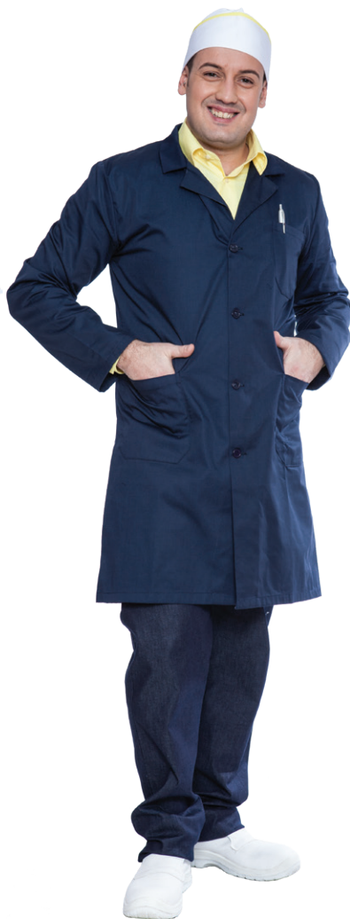
01 - ● Blu Navy