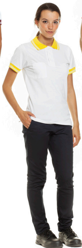
1106 - ● Giallo