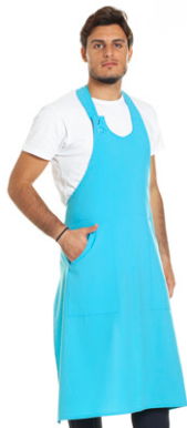
23 - ● Turchese