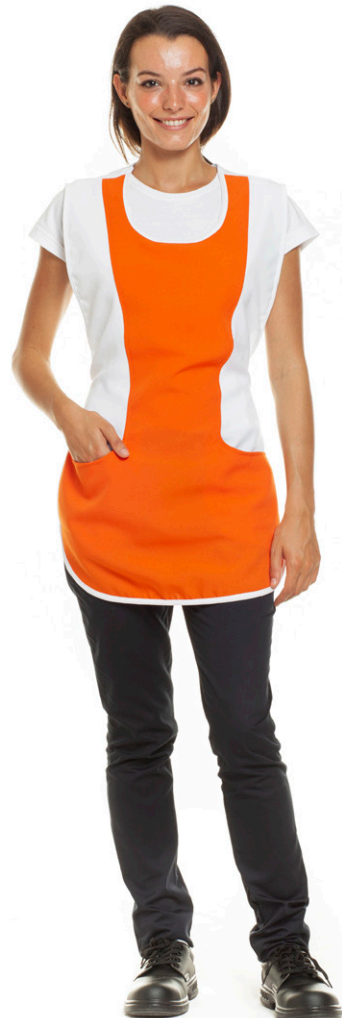
1103 - ● Arancio