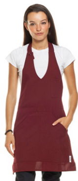
26 - ● Bordeaux