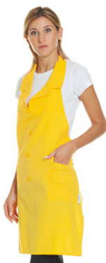
06 - ● Giallo