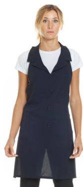
01 - ● Blu Navy