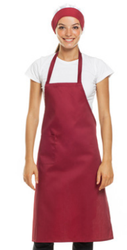
26 - ● Bordeaux