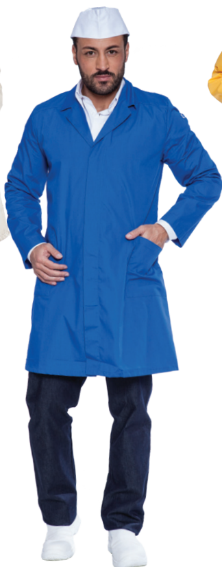
04 - ● Blu Royal