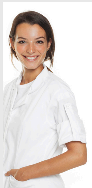
Manica che si arrotola con bottone