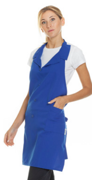
04 - ● Blu Royal