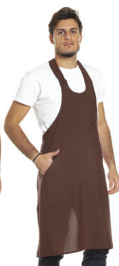
30 - ● Marrone

Accessori disponibili negli stessi colori