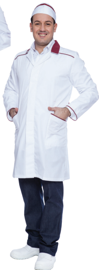
11-26 - ● Bordeaux