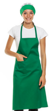
09 - ● Verde