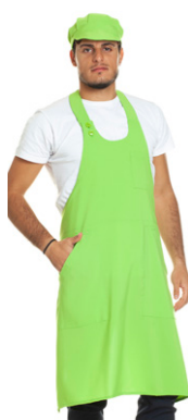
12 - ● Verde Mela