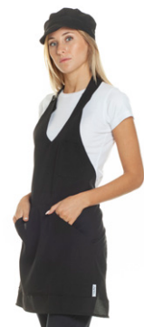
08 - ● Nero