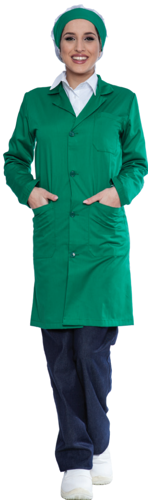
09 - ● Verde