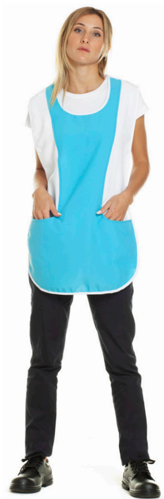
1123 - ● Turchese