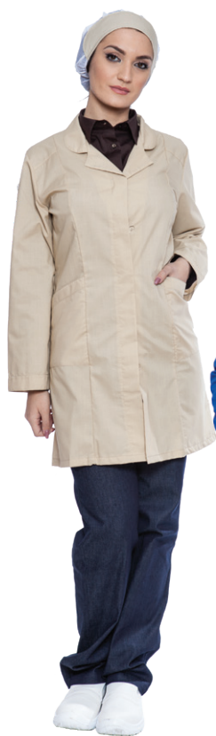
25 - ● Beige