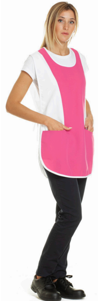
1107 - ● Fuxia