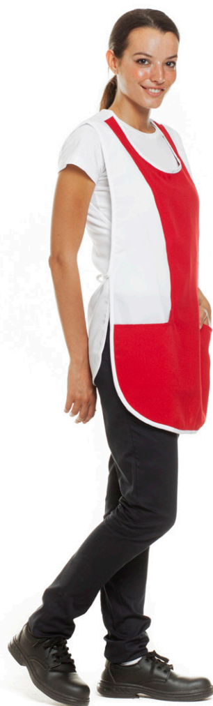
1105 - ● Rosso