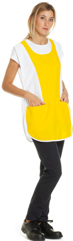
1106 - ● Giallo