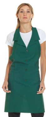
09 - ● Verde