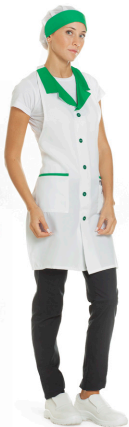
1109 - ● Verde