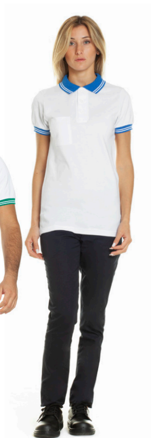
1104 - ● Blu Royal