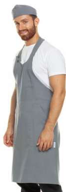
02 - ● Grigio