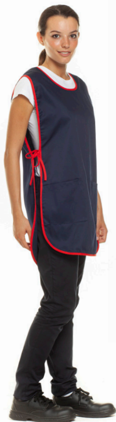
01/05 - ●● Blu Navy / Rosso