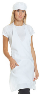
11 - ○ Bianco