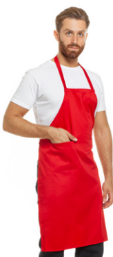
05 - ● Rosso