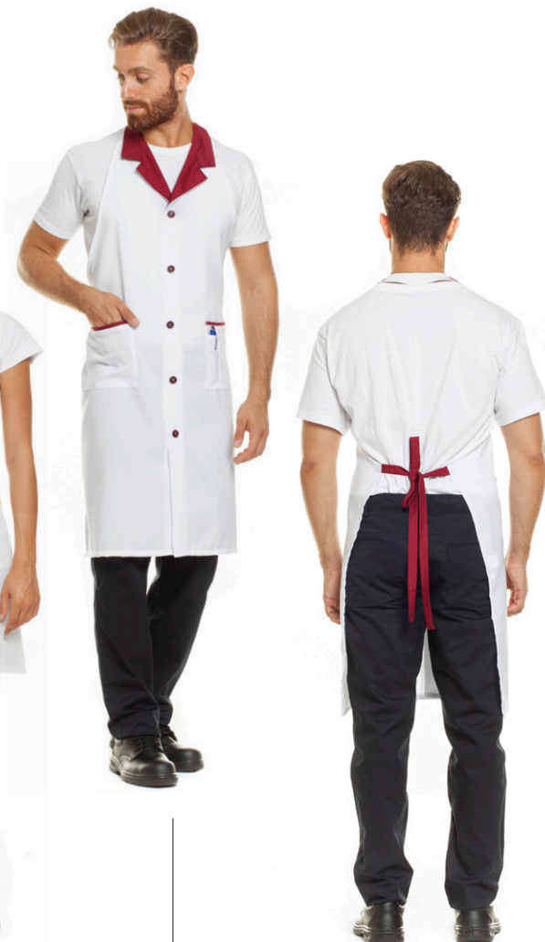
1126 - Bordeaux