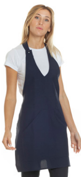
01 - ● Blu Navy