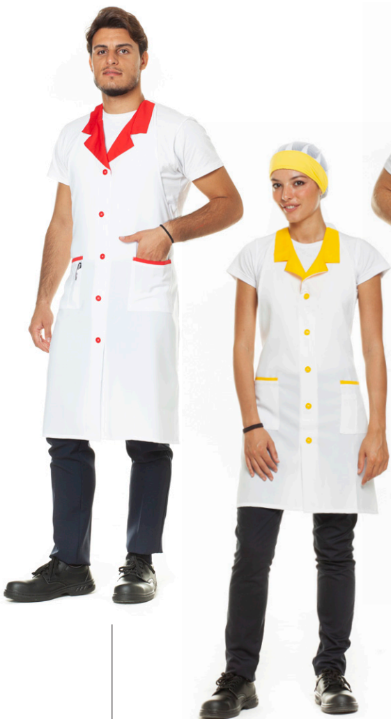
1105 - Rosso