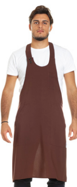
26 - ● Bordeaux