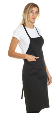
08 - ● Nero