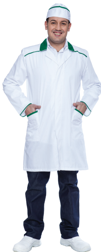
11-09 - ● Verde