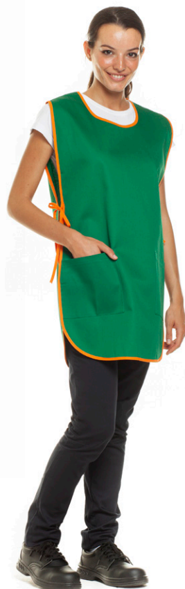
09/03 - ●● Verde / Arancio