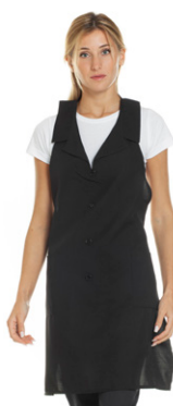
08 - ● Nero