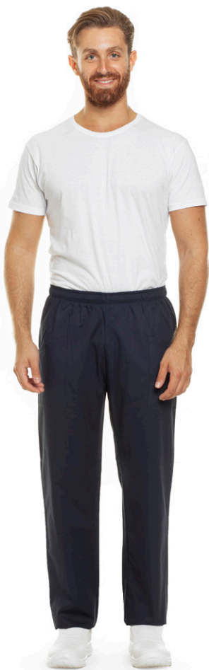
01 - ● Blu Navy