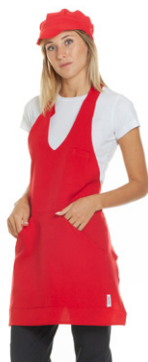
05 - ● Rosso