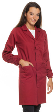
26 - ● Bordeaux