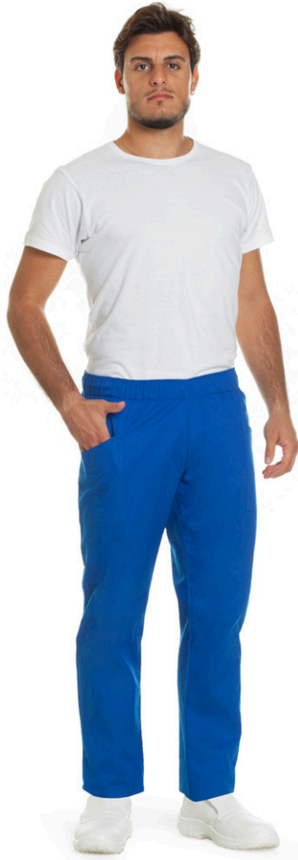
04 - ● Blu Royal