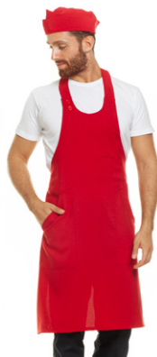
05 - ● Rosso