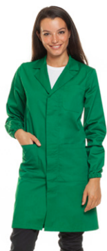
09 - ● Verde