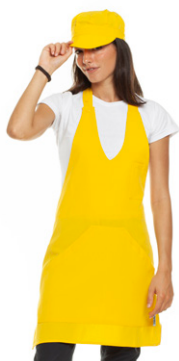
06 - ● Giallo