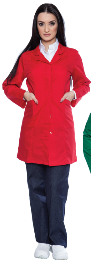
05 - ● Rosso