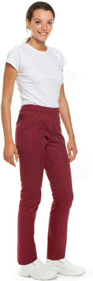
26 - ● Bordeaux