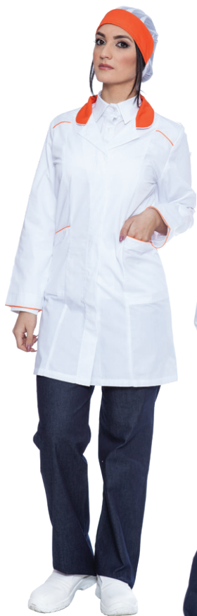
11-03 - ● Arancio