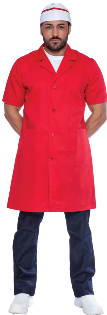
05 - ● Rosso