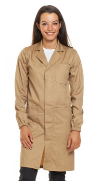
25 - ● Beige