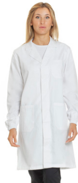
11 - ○ Bianco