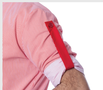
Manica che si arrotola con bottone