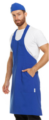
04 - ● Blu Royal