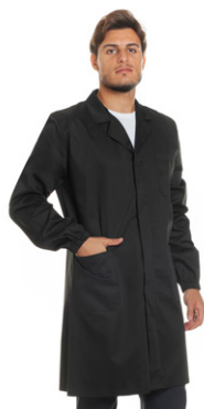
08 - ● Nero