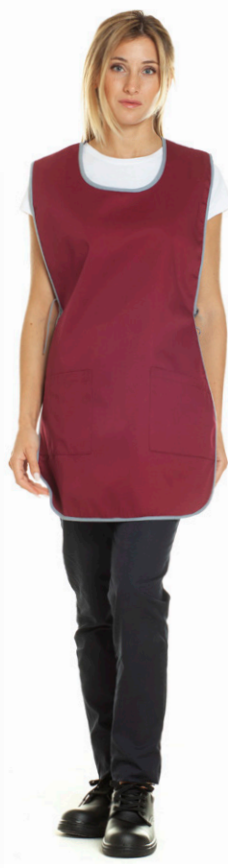
26/02 - ●● Bordeaux / Grigio