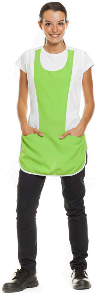
1112 - ● Verde Mela