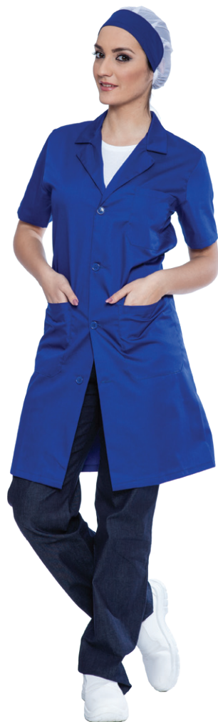
04 - ● Blu Royal