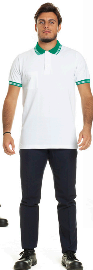
1109 - ● Verde