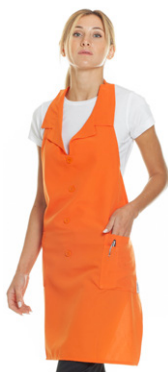
03 - ● Arancio