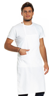
11 - ○ Bianco