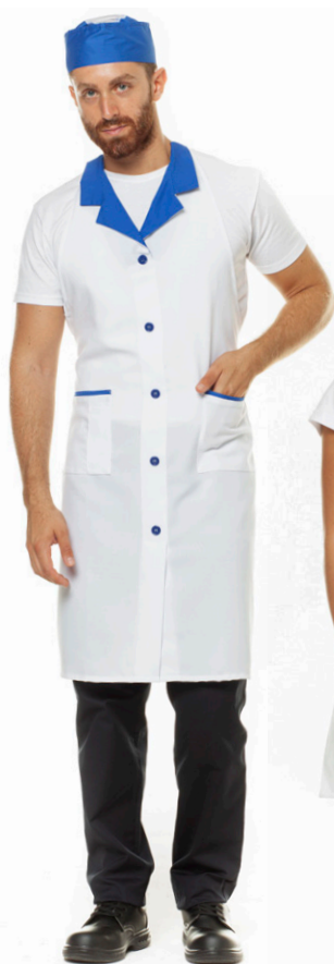
1104 - ● Blu Royal