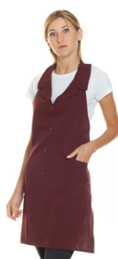
26 - ● Bordeaux