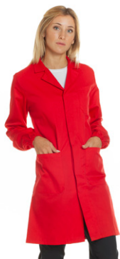
05 - ● Rosso