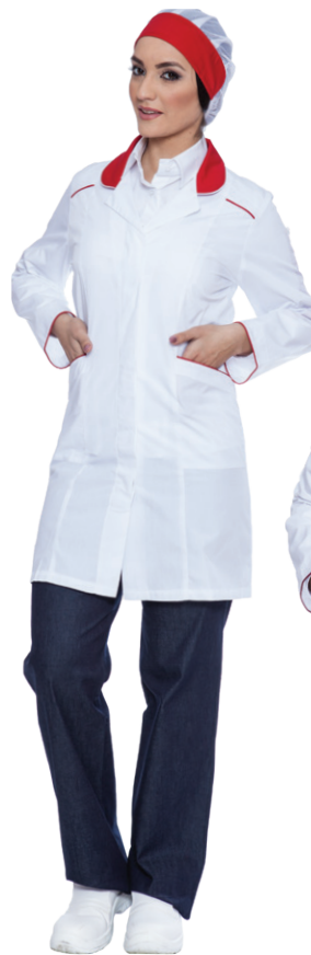
11-05 - ● Rosso