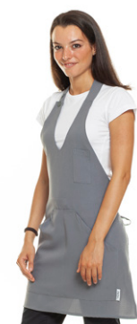
02 - ● Grigio