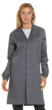
02 - ● Grigio