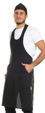
08 - ● Nero