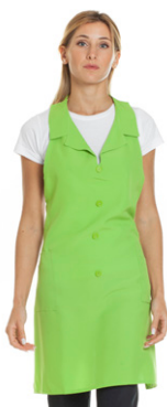
12 - ● Verde Mela