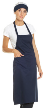
01 - ● Blu Navy