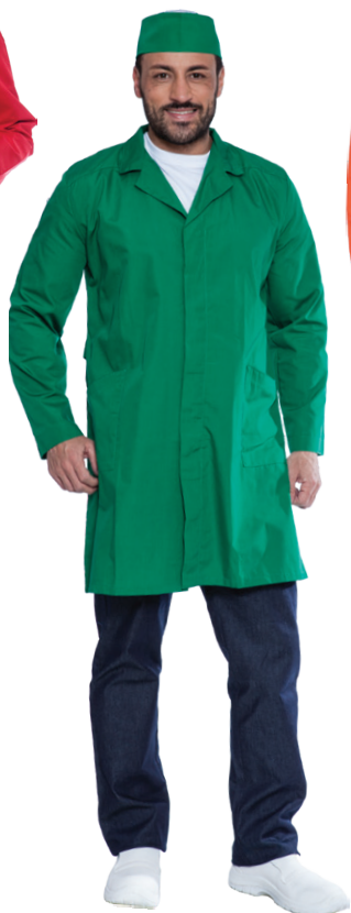
09 - ● Verde