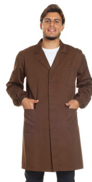
30 - ● Marrone