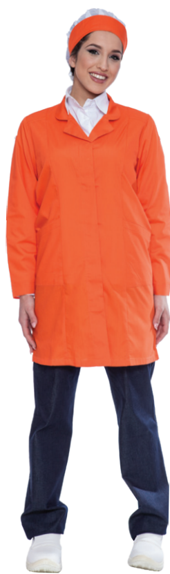
03 - ● Arancio