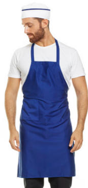
04 - ● Blu Royal