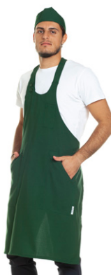
09 - ● Verde