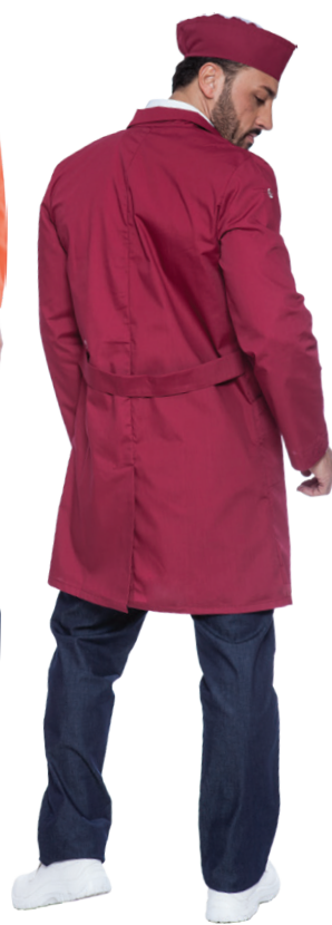
26 - ● Bordeaux