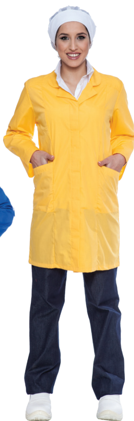
06 - ● Giallo