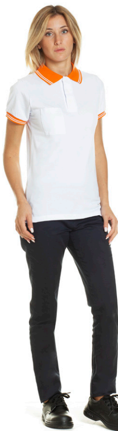
1103 - ● Arancio