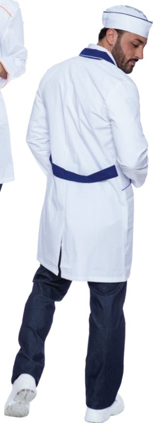
11-04 - ● Blu Royal