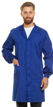
04 - ● Blu Royal