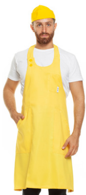
06 - ● Giallo