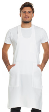
11 - ○ Bianco